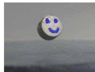
超伝導体の上で 浮遊する磁石