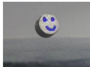
超伝導体の上で 浮遊する磁石